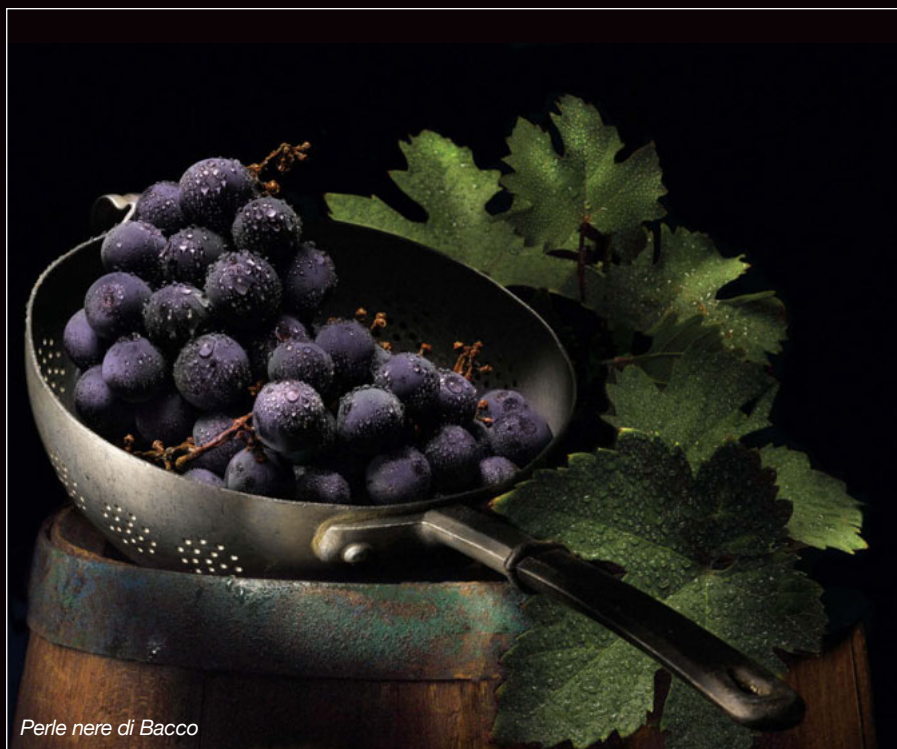
Perle nere di Bacco