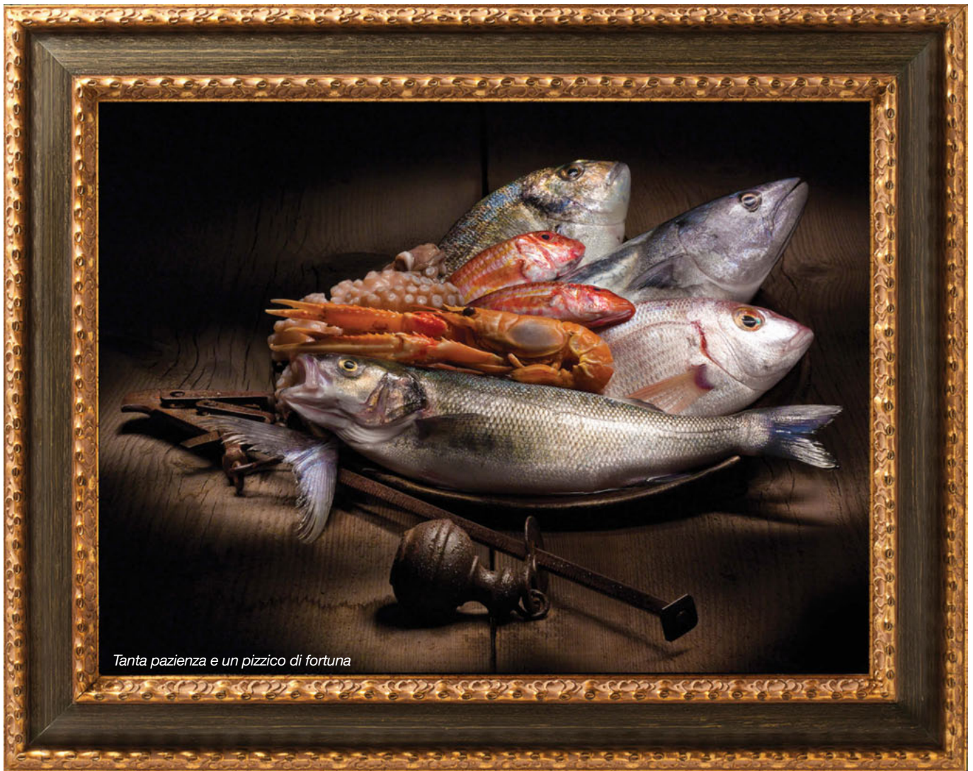
Tanta pazienza e un pizzico di fortuna

figure è evidenziata dalla particolare illuminazione che teatralmente sottolinea i volumi dei soggetti, facendoli improvvisamente uscire dal buio della scena." Sono pochi i quadri in cui il pittore lombardo dipinge lo sfondo, che rimane invece nettamente in secondo piano rispetto ai soggetti: i veri e soli protagonisti della sua opera. Il caravaggismo è una corrente pittorica nata a cavallo del XVI e XVII secolo che si rifà agli schemi artistici introdotti da Caravaggio. L'influenza di Caravaggio sulla nuova pittura barocca fu profonda e rivoluzionaria. La resa della realtà attraverso l'uso dei forti contrasti di luce ed ombra, non era mai stata tanto veritiera e vitale. Nei dipinti dei pittori caravaggeschi si ritrova questo grande realismo soprattutto nel riprodurre nature morte ed interni con figure umane, rappresentate queste figure generalmente su sfondi monocromi (spesso scurissimi, dipinti con campiture