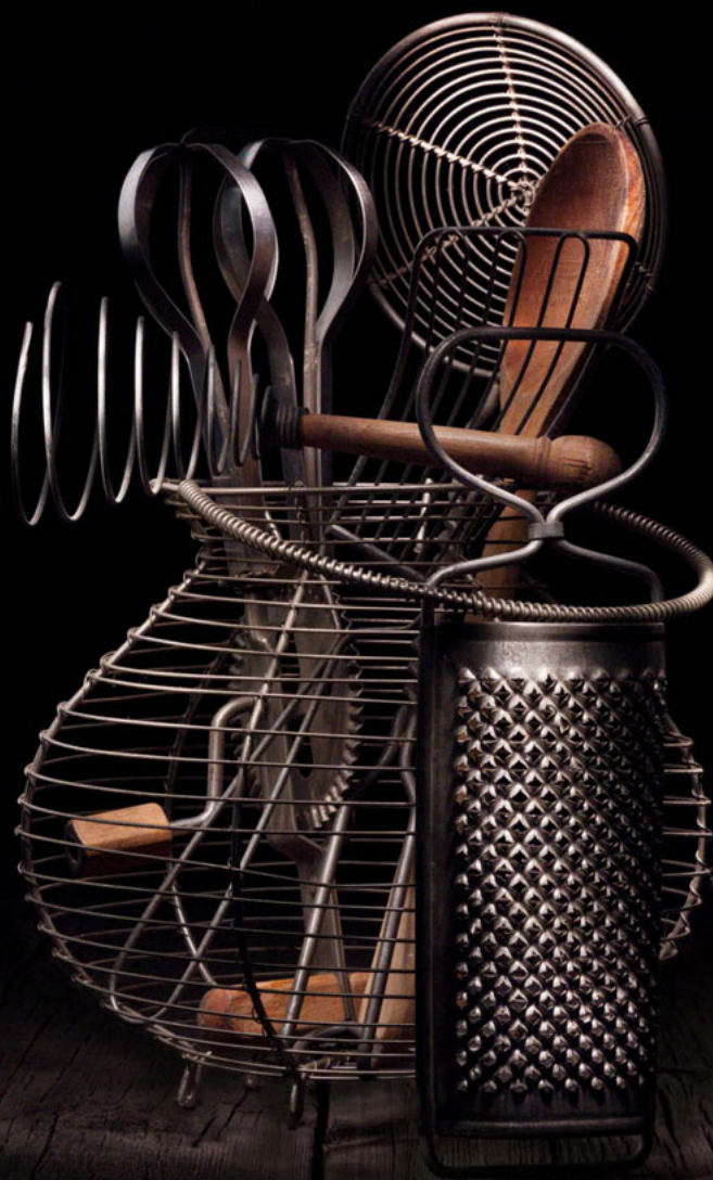
Dentro la credenza