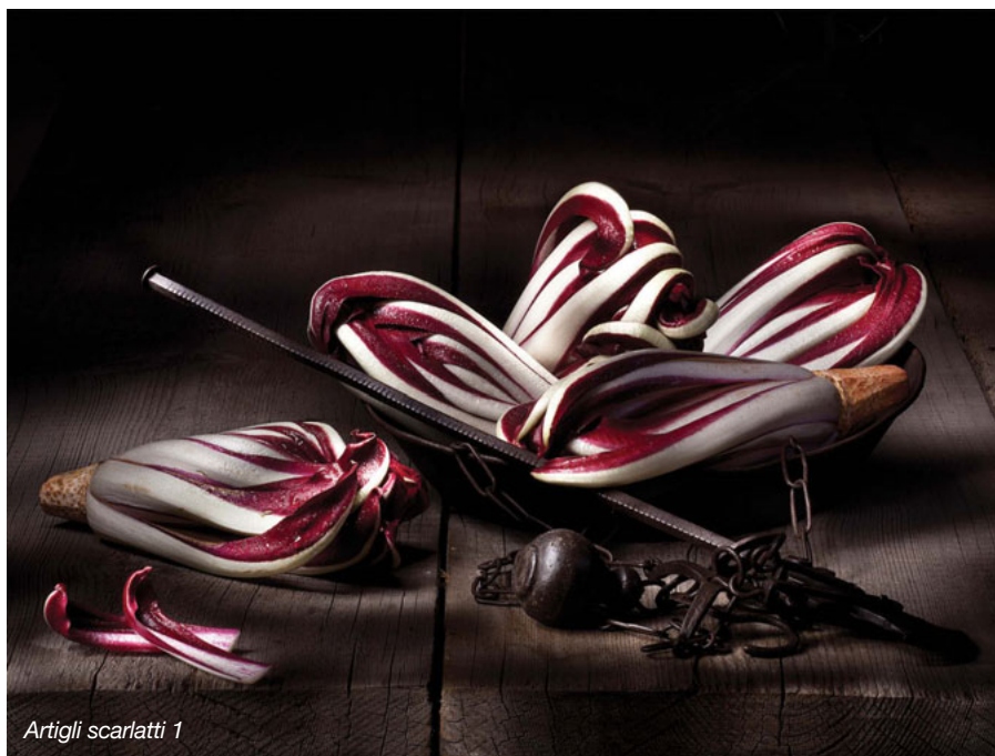
Artigli scarlatti 1

lavoro a cui mi sono apprestato, ma allo stesso tempo non ho mai voluto salire in "cattedra" divulgando messaggi dal "grigiore intenso" e dalla pesantezza stomachevole". Nel suo futuro personale Marcialis vede anche un riavvicinamento alla terra, con un progetto di agriturismo in cantiere. Secondo lui, la nostra società potrebbe guadagnare molto dalla riscoperta delle sue radici contadine? "Per essere precisi, - dice -le mie di radici affondano in laguna visto che sono nato a Venezia, ma battute a parte, il mio prossimo progetto di vita sarà una nuova avventura nel mezzo delle colline marchigiane." Allora, buona fotografia! E... buon appetito! ■